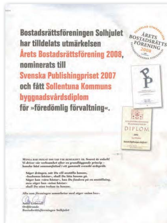
Här en av föreningens egna »profilannonser«.